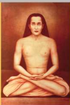
Babaji Lahiri Mahashaya Swami Shriyukteshwar Giri Sanyal Mahashaya Paramahansa Yogananda Swami Satyananda Giri Paramahansa Hariharananda Paramahansa Prajnanananda